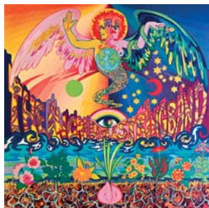
(Det färgsprakande omslaget till 5000 Spirits )

Men i söder finns det många vajande träd; Ååh ska den myskrosdoften lätta plågan din; i den varma söderns vindars blomst igen.