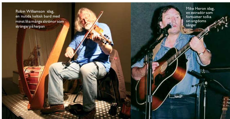
Robin Williamson idag, en nutida keltisk bard med minst lika många skrinor som strängar på harpan